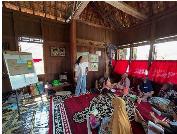
Gambar 4. Training Feminist