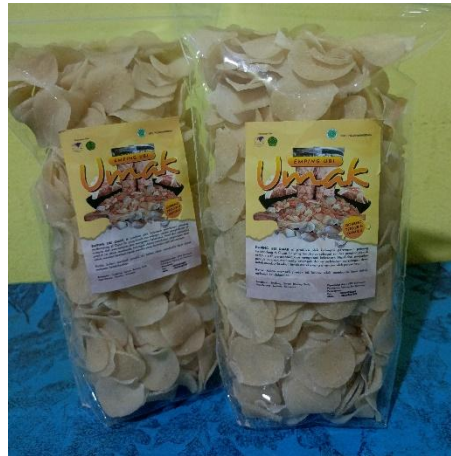
Gambar 4. Emping Ubi Umak