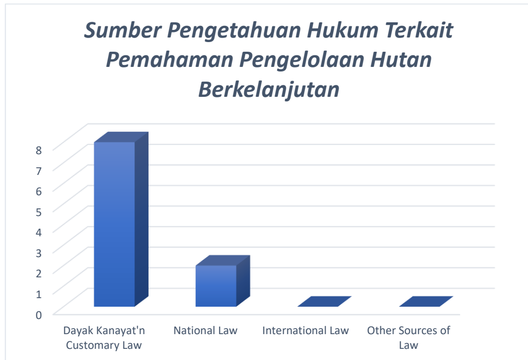
Gambar 3. Sumber Pengetahuan Hukum Terkait Pemahaman Pengelolaan Hutan Berkelanjutan